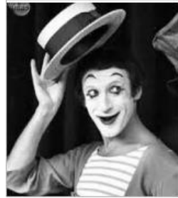
MIME MARCEAU (Marcel Mangel) Schauspieler