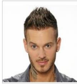
M. POKORA Singer