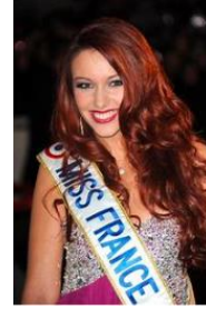
Delphine WESPISER Miss Frankrich 2012